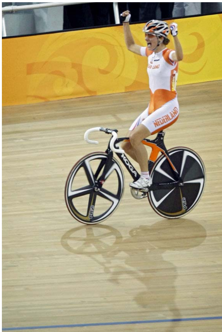
Marianne Vos wint Olympisch goud op de wielerveenbaan in Beijing (2008). In 2010 worden in Apeldoorn de wereldkampioenschappen wielrennen op de baan georganiseerd.

Nederland is wereldwijd het belangrijkste fietsland. Prestaties in de wielersport ondersteunen dit beeld krachtig. Het positieve beeld kan verder worden versterkt door structureel in te zetten op de organisatie van grote en aansprekende fiets- en wielerevenementen.