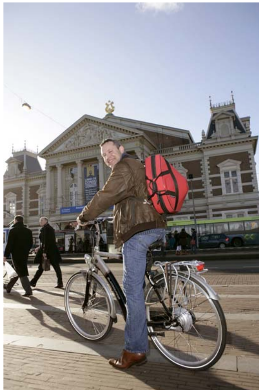
De elektrische fiets of E-bike.

Eén van de meest recente vernieuwingen binnen de fietsbranche is de introductie van de elektrische fiets. Deze E-bike is een fiets waarbij de kracht die de fietser op de pedalen zet, dankzij een elektrisch systeem wordt aangevuld. Daardoor wordt het fietsen gemakkelijker en wordt het mogelijk om zonder extra inspanning een grotere afstand te overbruggen.