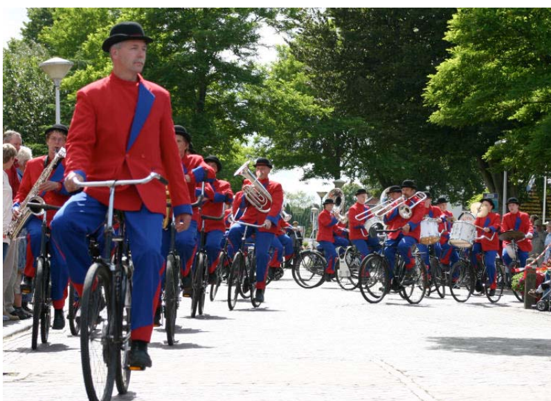
Het fietsende muziekeloton van Crescendo uit Opende (Gr)