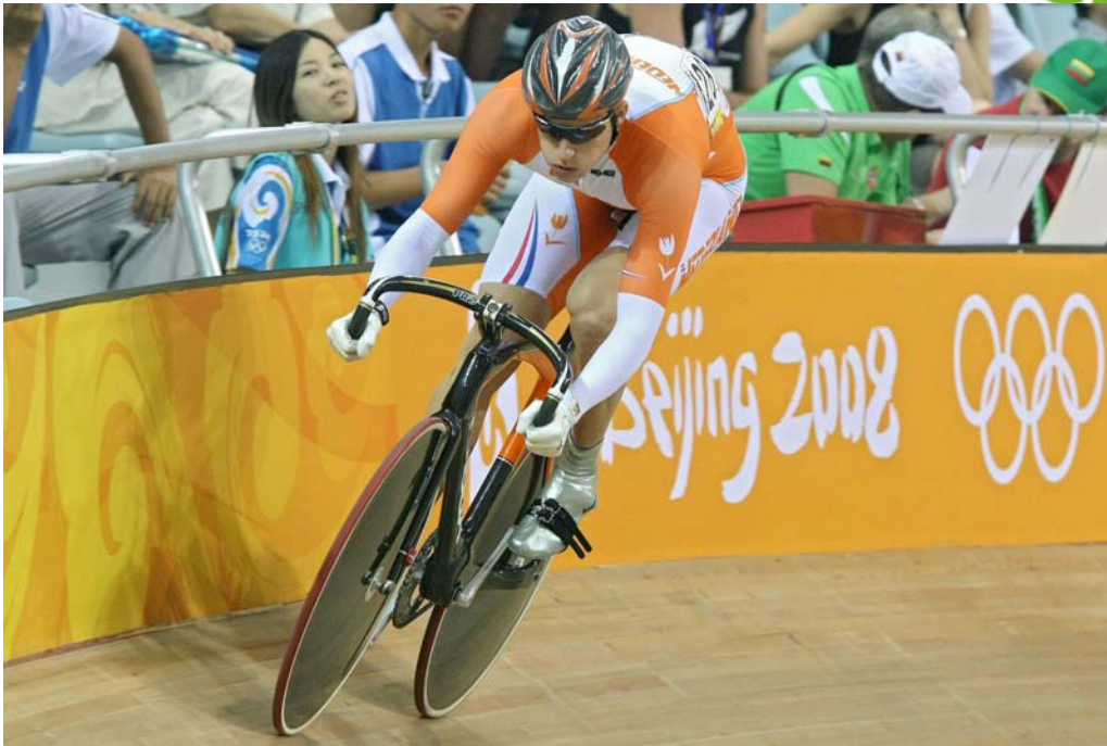
Meervoudig sprintkampioen Theo Bos in actie in Beijing.

Eén van de meest recente vernieuwingen binnen de fietsbranche is de introductie van de elektrische fiets. Deze E-bike is een fiets waarbij de kracht die de fietser op de pedalen zet, dankzij een elektrisch systeem wordt aangevuld. Daardoor wordt het fietsen gemakkelijker en wordt het mogelijk om zonder extra inspanning een grotere afstand te overbruggen.